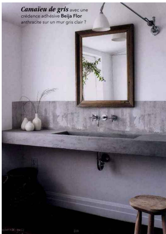
Camaïeu de gris avec une crédence adhésive Beija Flor anthracite sur un mur gris clair ?