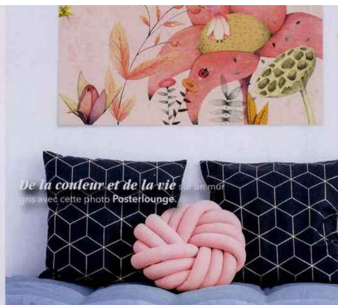
De la couleur et de la vie sur un mur gris avec cette photo Posterlounge .