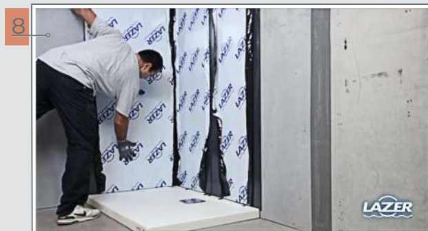
8 Enchasser le deuxième panneau dans le profilé de liaison.