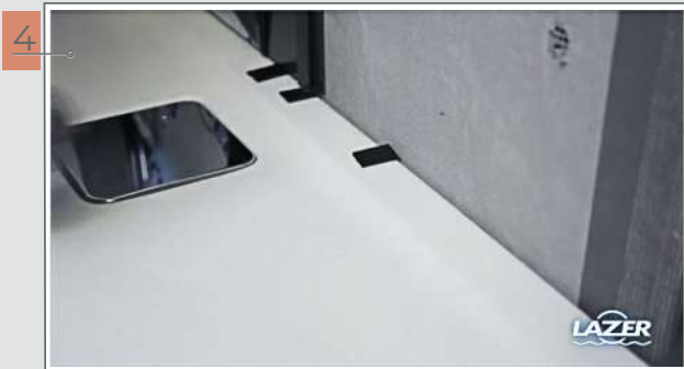
4 Poser les câbles de sol (fournies).