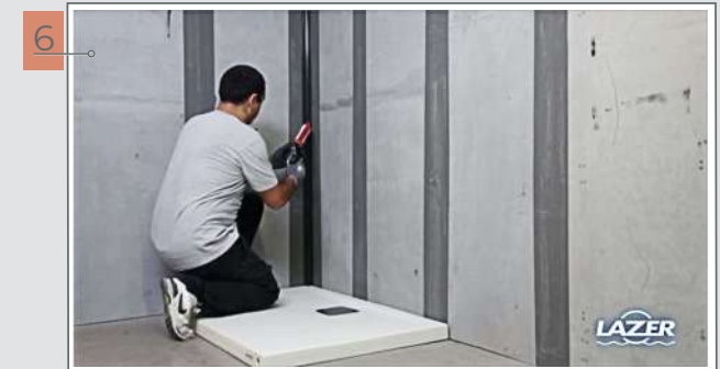
6 Déposer un cordon de mastic-colle Panofix dans le profilé.