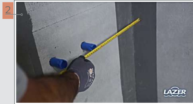
2 Repérer le positionnement de la robinetterie.