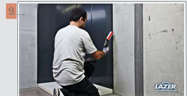
9 Poser les profilés de finition aux deux extrémités.