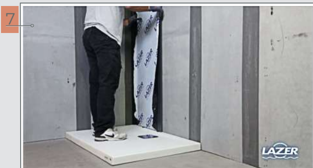
7 Enchasser le 1er panneau dans le profilé de liaison.