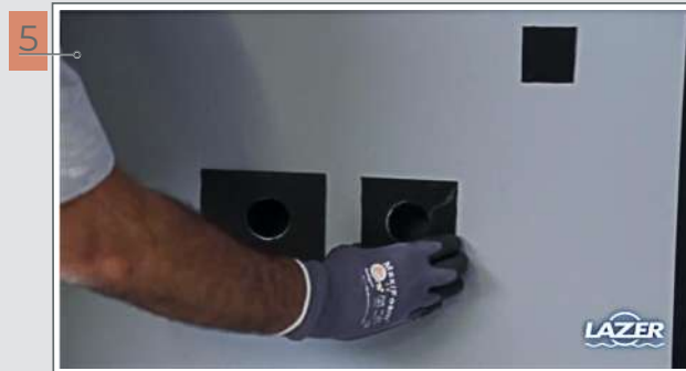
5 Poser les câbles de rattrapage à l'arrière du panneau.